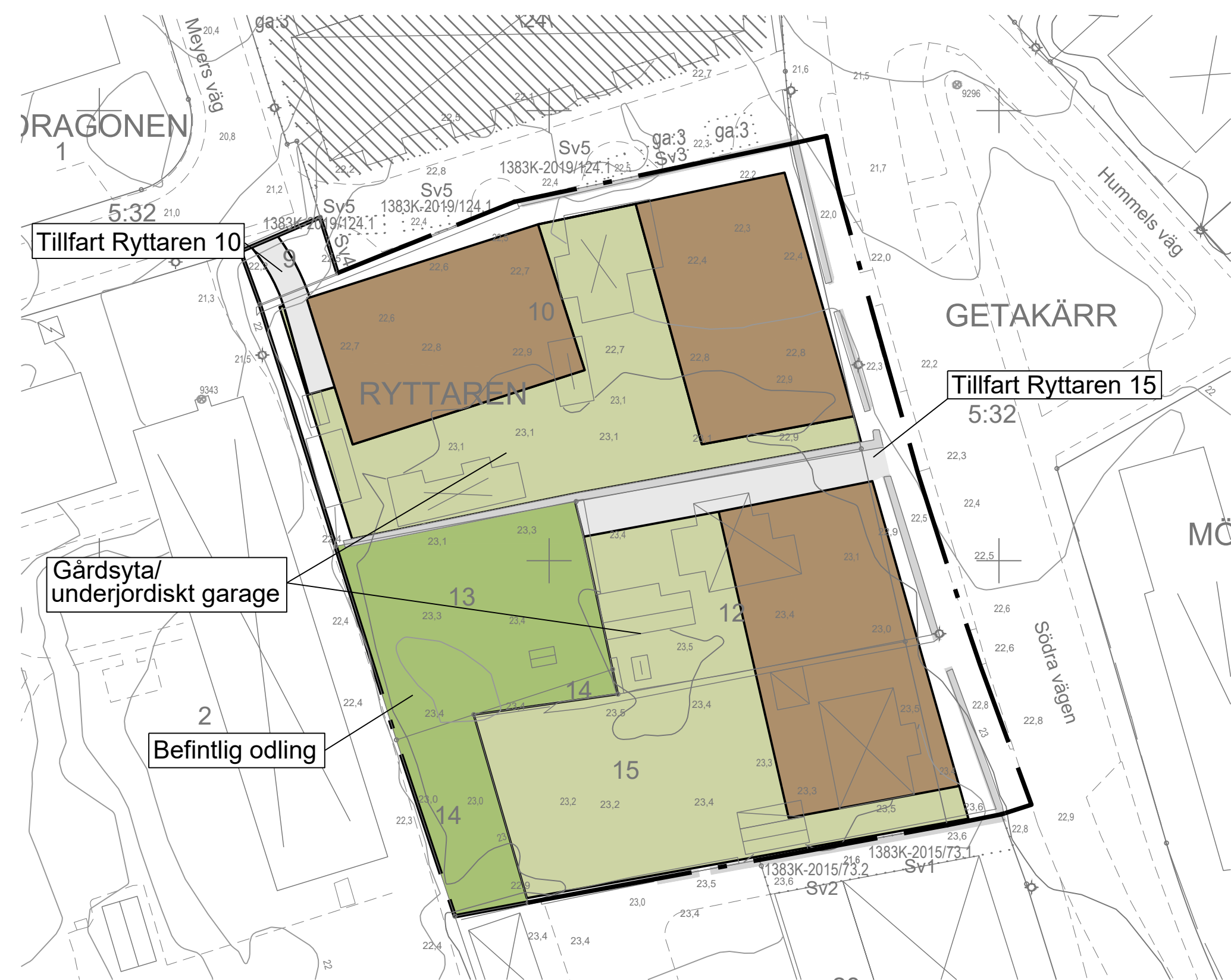
Illustration skala 1:500 (A1)